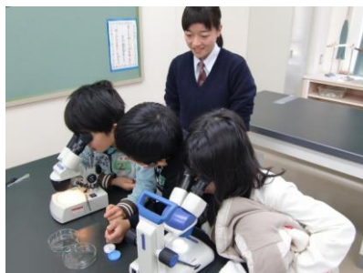
「プラナリアの観察実験」