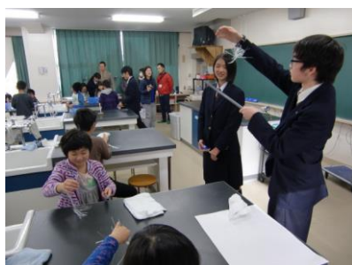
「静電気の不思議実験」

平成29年1月14日(土)に土曜学習において、「おもしろ理科実験講座」を行いました。講師には、伊丹北高等学校の自然科学部の生徒が桜台小学校に来てくれました。静電気の不思議実験、プラナリアの観察実験、あぶり出し体験など、高校生に優しく丁寧に教えてもらいながら実験をしました。