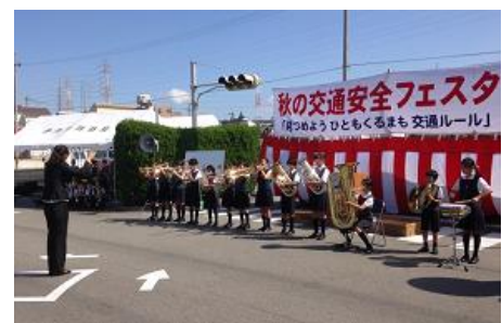
<秋の交通安全フェスタ>