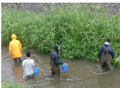
<リバーサイドフェスタ>

ジュニアバンドクラブの演奏をはじめ、桜台小学校の児童や教職員、地域の方々など、子どもから大人までがともに集い、学び、楽しむ機会となりました。