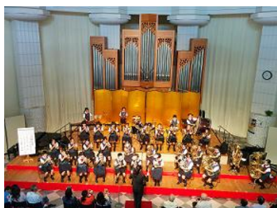
<シルバーフェスティバル>