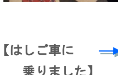
【はしご車に乗りました】