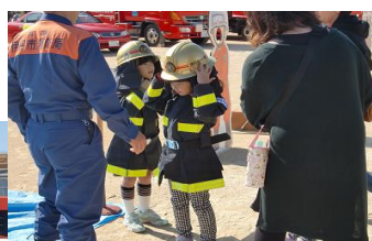
【消防士さんの姿になりました】