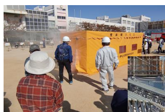
【煙の中を歩きました】

午後からは、 学校運営協議会(コミュニティスクール) を開催いたしました。全国学力・学習状況調査の結果報告と今後の取組など、 学校をより良くするための話し合い が活発に行われました。