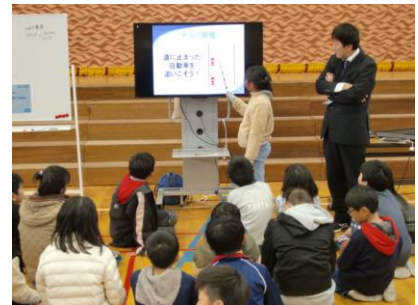
【さらにやってみたいことを 発表しました】