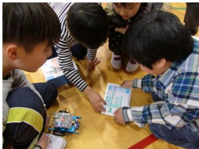
【タブレットを使って プログラムを入力】

参観していた先生方から、「桜台の子どもは仲間と力を合わせて、上手にタブレットを操作しているなあ」と感心の声が上がっていました。