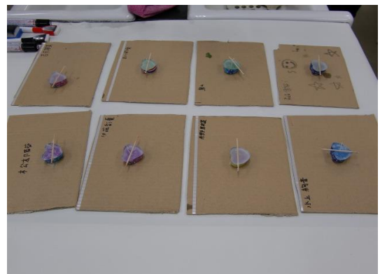
【アロマキャンドルを作ろう】