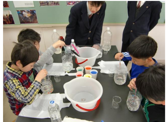
【カラフルカプセルを作ろう】

「カラフルカプセルを作ろう」、「アロマキャンドルを作ろう」、「入浴剤を作ろう」など、高校生に優しく丁寧に教えてもらいながら素敵なお土産もいただける実験をしました。