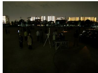
こども科学館の方からのお話 望遠鏡を使った星や月の観察