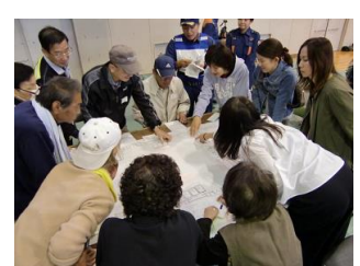
図面上で、誰をどこに避難させるか等の訓練