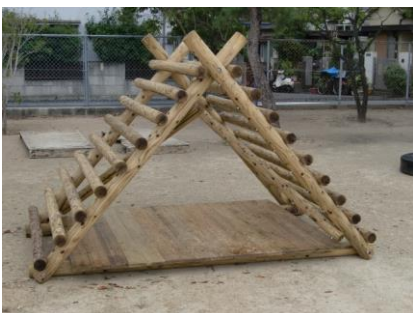
【ウッドマウンテン】

安全に留意して、体育の授業や休み時間などで、どんどん積極的に活用し、普段から体を動かしたり、運動したりして、健康で強い体をつくっていきましょう。