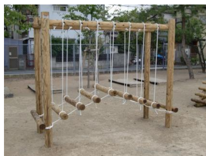
【ゆらゆら丸太渡り】